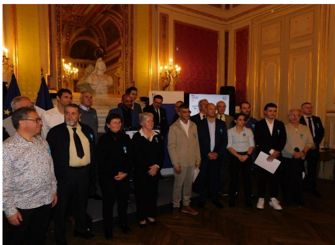
Photos du groupe honoré ce jour

"Recevoir la médaille interministérielle de bronze en 2015 a été pour moi un honneur. Rejoindre le Comité Départemental de l'Hérault en adhérent, c'est donner un sens collectif à cette reconnaissance".