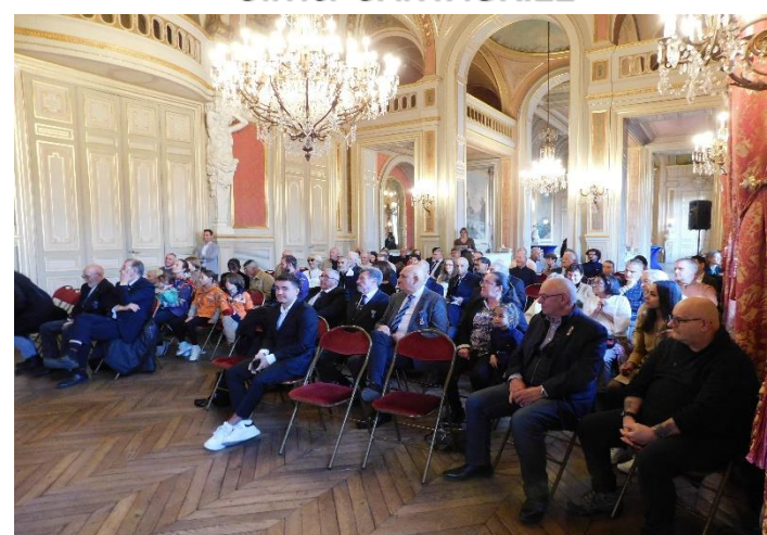
Une bonne chambrée pour une belle cérémonie