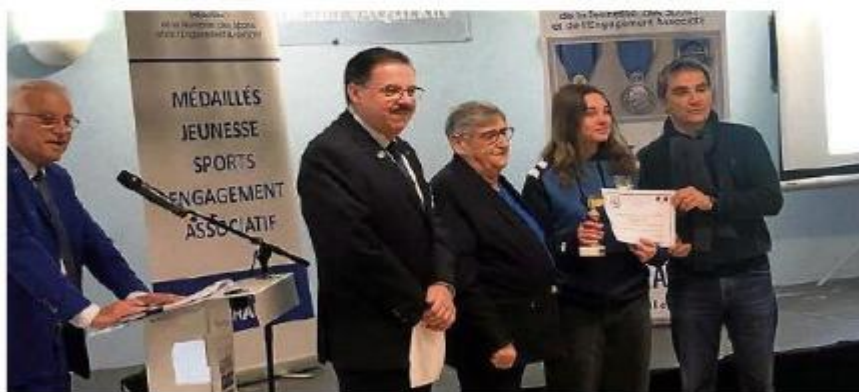
Le challenge Jeune arbitre pour Lan Na Vigne-Augugliaro.

À cette occasion, le président du comité a rappelé que la prochaine assemblée générale se déroulerait le samedi 31 janvier à 10 h, espace Marie-Christine-Bousquet, à Lodève.