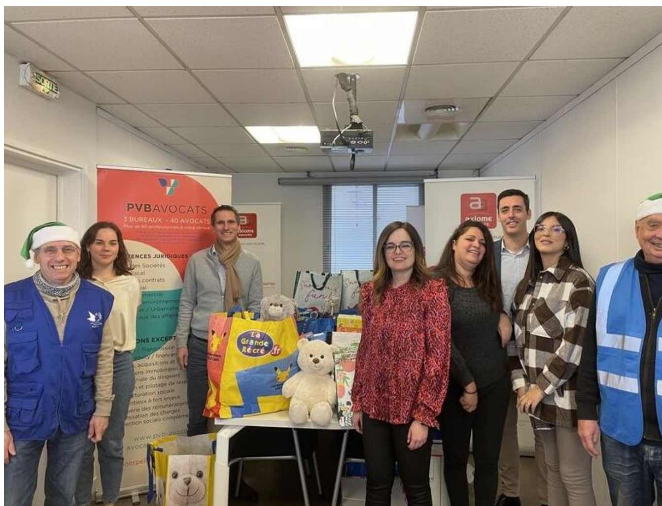
L'équipe des bénévoles du Secours Populaire de l'Hérault

L’association espère que la fête du 16 novembre renforcera la chaîne de solidarité dont dépend une partie croissante de la population héraultaise.